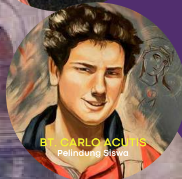
Bt. CARLO ACUTIS Pelindung Siswa