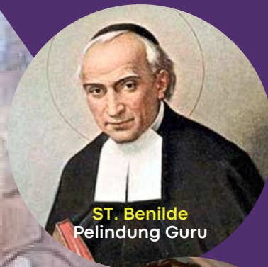
ST. Benilde Pelindung Guru