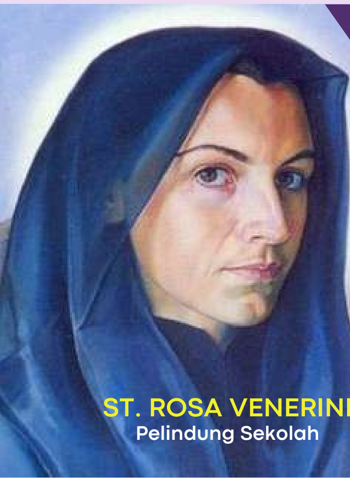
ST. ROSA VENERINI Pelindung Sekolah